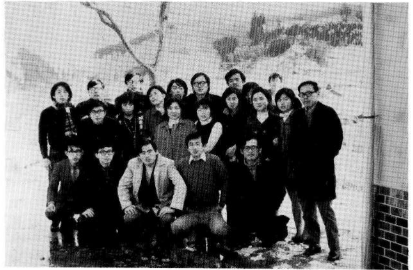
春 合 宿 (昭和46年3月6日 奥津にて)