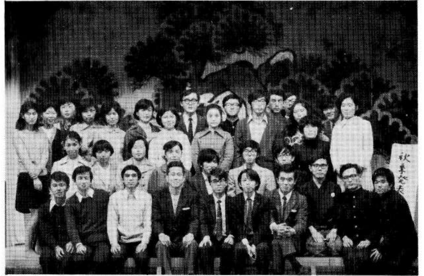
秋 季 発 表 会 (昭和45年11月21日 於学生会館)